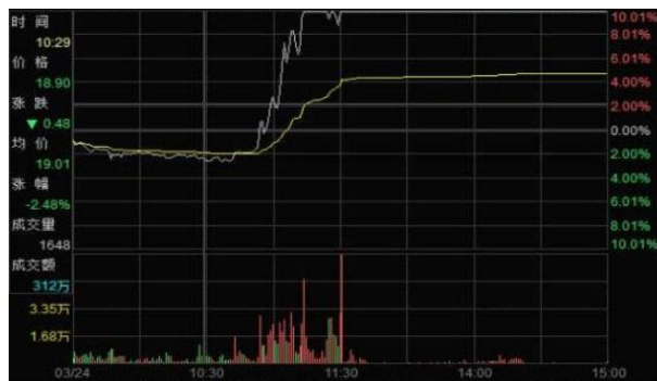
图 1 3 月 24 日拉抬“X” 股价至涨停并封涨停板

2015 年 3 月 23 日，唐某某买入“X” 214 万股，成交金额 4144 万元，成交均价 19.37 元，完成建仓。第二天，唐某某从上午 10:42 开始，以 18.91 元至涨停价 21.32 元的价格和 100 倍于同档位其他投资者申报总量，在短短 31 分钟内将“X” 股价拉至涨停，上涨幅度达 12.7%。中午收盘前“X” 短暂打开涨停，唐某某又以涨停价和超过卖盘 55 倍的申买量，5 分钟内将股价再次推至涨停。下午开盘后，唐某某继续以涨停价申报买入 2796 万股，形成巨量堆单将股价封死在涨停板上。