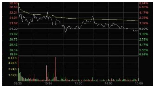
图 2 3 月 25 日“X”股价分时走势

活跃在涨停板上的操纵者和正常投资者的交易行为有明显的区别,他们在成功拉升股价后随即反向卖出,或者大量撤单以避免真实成交,反映出他们的意图在诱骗其他投资者跟风买入,而没有真实投资目的。这种行为违反了《证券法》第七十七条禁止单独或者通过合谋,集中资金优势、持股优势连续买卖,或者以其他手段操纵证券交易价格或者证券交易量的规定,构成《证券法》第二百零三条操纵市场的情形,当然难以逃脱证监会的法眼,2014年和2015年唐某某因操纵市场先后被证监会两次行政处罚,为规避监管,唐某某转战香港,通过沪港通继续操纵A股股票,“魔高一尺、道高一丈”,2017年证监会再次将唐某某等人绳之以法,前后共开出12亿元罚单。